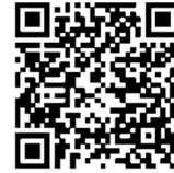
Google Play Store