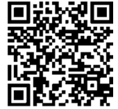
Apple App Store