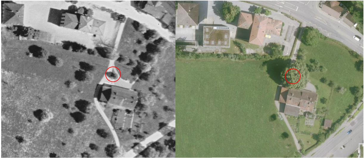
Abb. 2: Im Jahr 1932 stand die Sommerlinde bereits einige Jahre auf dem Hofplatz, die Krone wirft bereits Schatten auf die Zufahrt (linke Seite). Die mächtige Sommerlinde zeugt von der bäuerlich geprägten Kultur und prägt heute das Ortsbild.

Alte, sehr grosse Bäume bieten Lebensräume für eine Vielzahl Lebewesen, wobei die verschiedenen Baumarten erhebliche Unterschiede zeigen. Sommerlinden bieten im Vergleich zu anderen Baumarten besonders vielen Moosen, Flechten, Wildbienen, Schmetterlingen, Käfern, Vögeln und Säugetieren Nahrung, Fortpflanzungsmöglichkeiten und Verstecke. Mit zunehmendem Alter nimmt die Anzahl von Lebensräumen zu (sogenannte Mikrohabitate). Aus diesem Grund sind alte Bäume als wertvoller einzustufen als junge Bäume. Das Kronenvolumen ausgewachsener Bäume ist für die Beurteilung des Werts für die Biodiversität ebenfalls entscheidend. Sommerlinden erreichen mit fortschreitendem Alter eine ungleich grössere Krone ( > 7'000\text{m}^3 ) als beispielsweise der Feldahorn ( < 800\text{m}^3 ). Die Sommerlinden zählen aus diesen Gründen bezüglich Biodiversität zu den wertvollsten einheimischen Baumarten. Sie werden mit einem Biodiversitätsindex von 5.3 bewertet, nur Stieleichen werden als noch wertvoller eingeschätzt (Biodiversitätsindex 5.4).