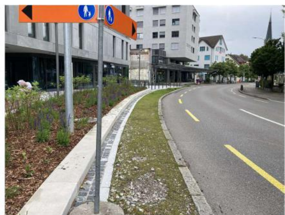
Abbildung 2 Eintöniger Grasstreifen an der Bahnhofstrasse Wetzikon

Artenreiche Blühstreifen wie in Abb. 1 können mit einfachen Mitteln durch die Wahl einer geeigneten Ansaatmischung kostengünstig angelegt werden und sind nicht oder kaum aufwändiger im Unterhalt