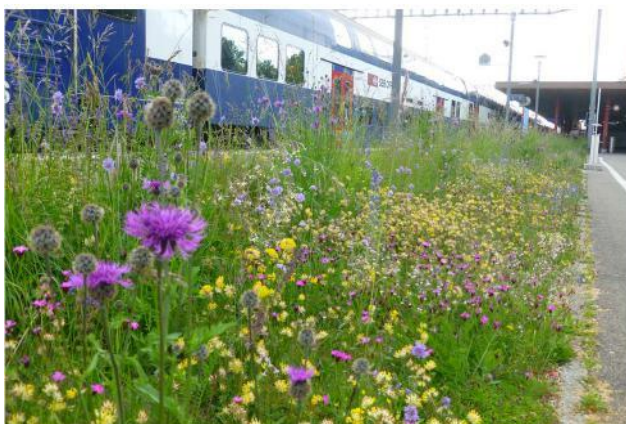
Abbildung 1 Artenreicher Blühstreifen am Bahnhof Wetzikon

Dies zeigt sich an den wenigen Ausnahmen, wo farbenfrohe Blühstreifen auf solchen Randflächen angelegt wurden (wie beispielsweise neben dem Gleis 1 am Bahnhof Wetzikon, Abb. 1): Hier sticht ins Auge, dass sich während der langen Blühperiode der artenreichen Ruderalflora täglich sehr viele Wetzikerinnen und Wetziker an der beeindruckenden Blütenpracht erfreuen. Und gleichzeitig bietet ebendiese Blütenpracht dank der sinnvoll ausgewählten Saatgutmischung trotz der isolierten Lage erstaunlich vielen Insekten Nahrung und Unterschlupf. Der Unterschied zu einem «wie üblich» begrüneten Randstreifen (Abb. 2) sind augenfällig – weder erfreut ein solcher Grünstreifen die vorbeikommenden Passanten, noch wird das Stadtbild positiv beeinflusst, und ökologisch ist ein solch eintöniger Grasstreifen wertlos.