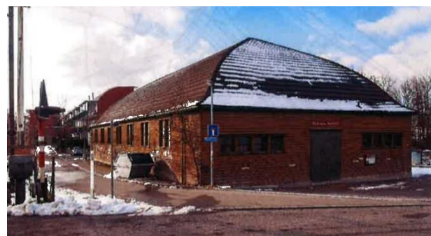
Ansicht von der Asylstrasse vom 11.01.2022

Seit Juni 2022 begleitet die kantonale Denkmalpflege die Fassadensanierung an der Reithalle und hat mit Verfügung Nr. 0325/2023 einen Beitrag aus dem Denkmalpflegefonds gewährt und sich somit direkt finanziell an der Fassadensanierung beteiligt. Zur Klärung der rechtlichen Grundlagen und der Zuständigkeiten sowie aus Gründen der Transparenz gegenüber der Öffentlichkeit sieht das Amt für Raumentwicklung (ARE) nun vor, die Reithalle im überkommunalen Inventar festzusetzen. Für eine Inventarfestsetzung ist eine Anhörung der Gemeinden im Gesetz nicht vorgesehen. Im Sinne der Transparenz wird der Stadtrat mit Schreiben vom 6. Dezember 2023 trotzdem von der Baudirektion eingeladen, bis am 2. Februar 2024 zur Übernahme ins überkommunalen Inventar Stellung zu nehmen.