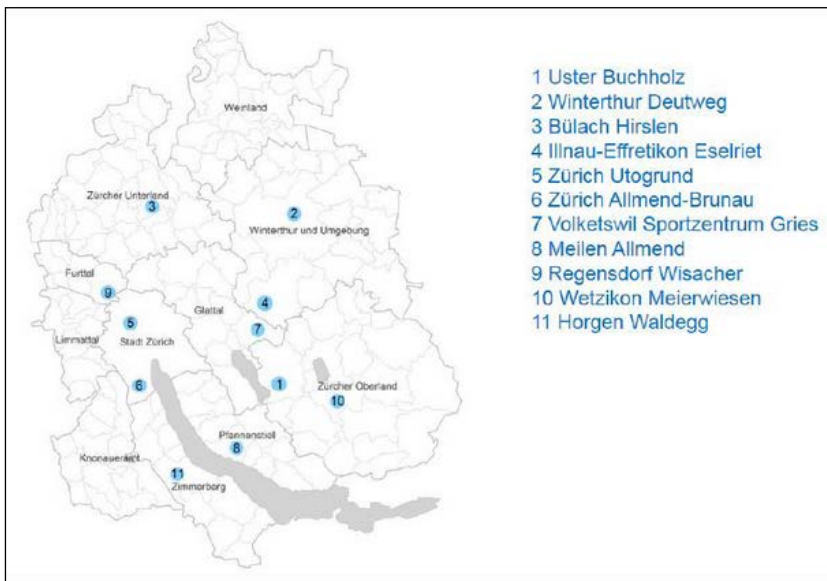
Abb. 1 Polysportive Zentren KASAK-Sportanlagen Kanton Zürich