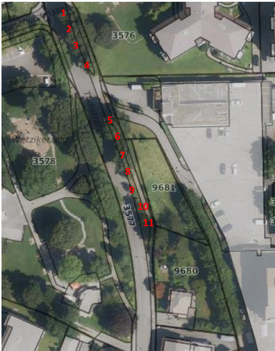
Abbildung 1: Die Baumreihe NLI 4.54 mit den 11 Winter-Linden entlang der Tödistrasse, Wetzikon.