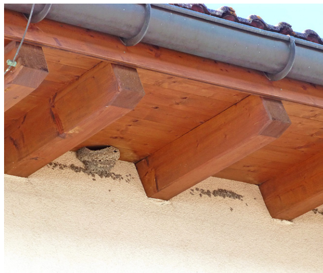
Fassade mit fertigem Naturnest und Ansätzen von Nestern.