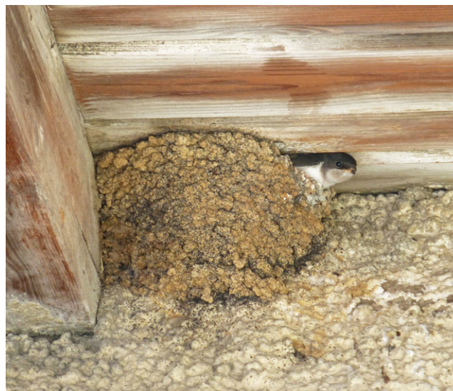
Typisches Fassadennest der Mehlschwalbe.